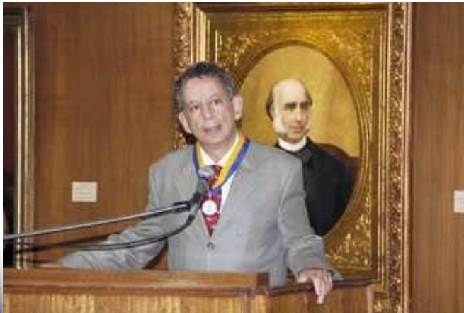
Dolabela, Visita Distinguida, diciembre 2014