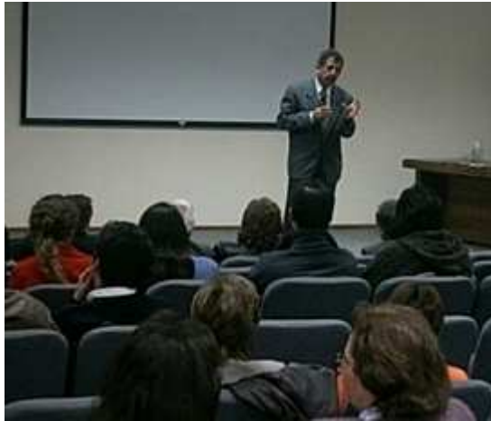
Taller Fernando Dolabela, mayo 2004